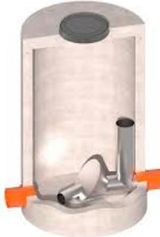
Regulator stożkowy z przelewem